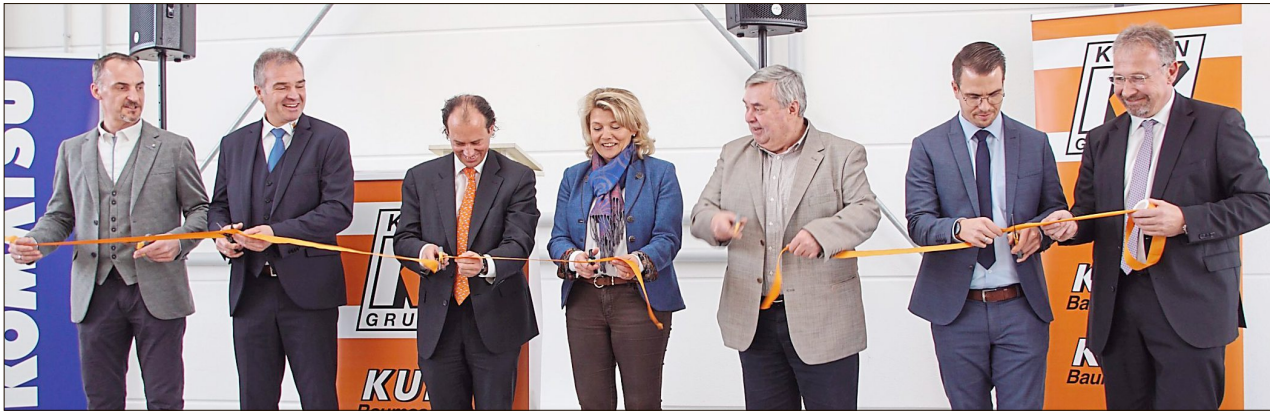
Symbolisch durchschnitten die Ehrengäste am Donnerstag ein Band.

Wörth. (red) Am Montag, 9. März, kommt Landrätin Tanja Schweiger nach Wörth. Um 19.30 Uhr beginnt die Veranstaltung im Gasthof Geier. Sämtliche interessierten Bürgerinnen und Bürger sind herzlich eingeladen, die Gelegenheit zu nutzen um die Landrätin live in Wörth zu erleben.