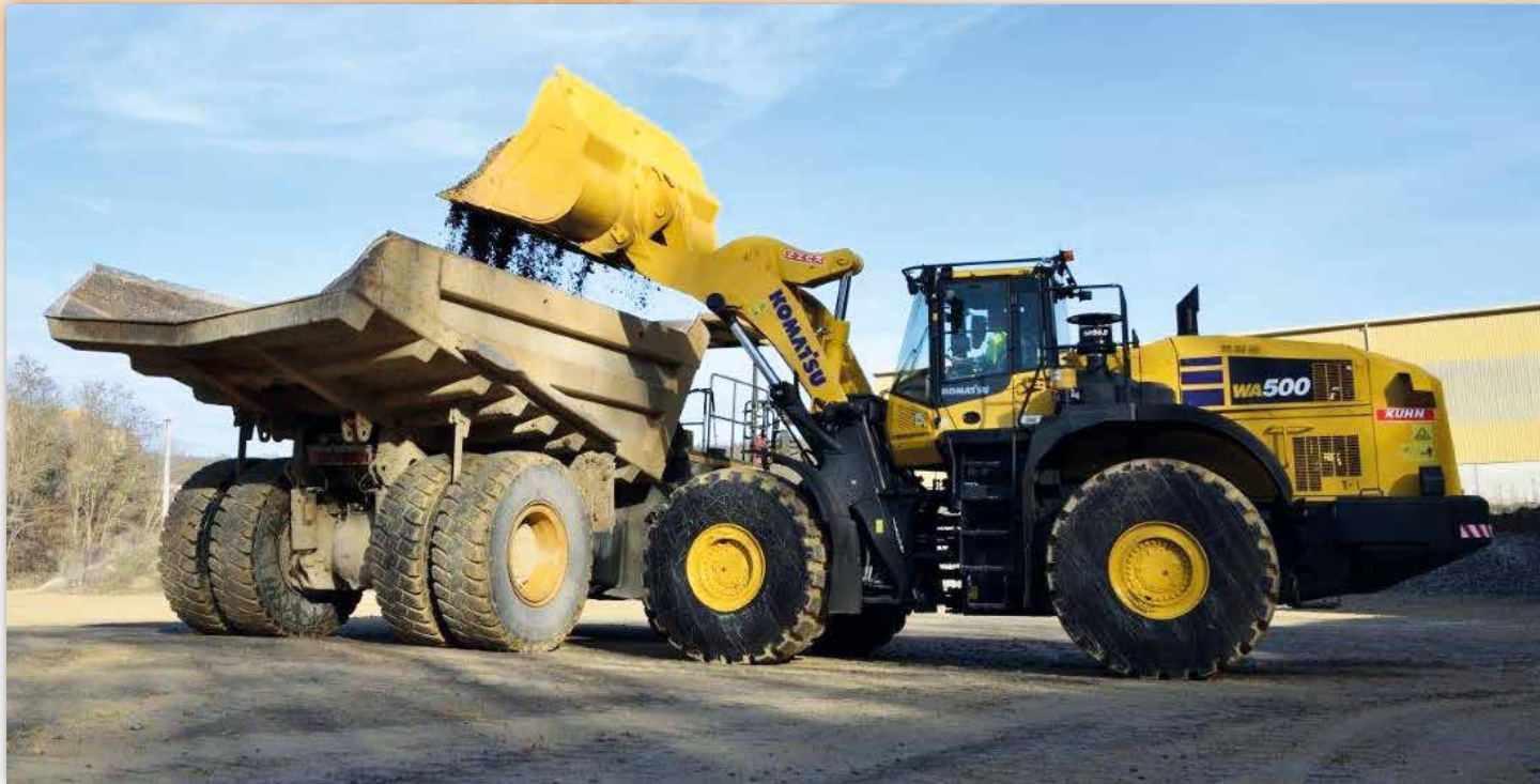
WA500-8Eo mit präziser Steuerung und hocheffizienter Schaufel bereit für den Einsatz mit hoher Produktivität

geschätzt. Ebenso vertraut man bei Lafarge auf die langjährige Zusammenarbeit mit Kuhn.