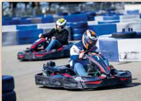
Ein unvergesslicher und erlebnisreicher Tag unter dem Motto „Wir haben SPASS, wir