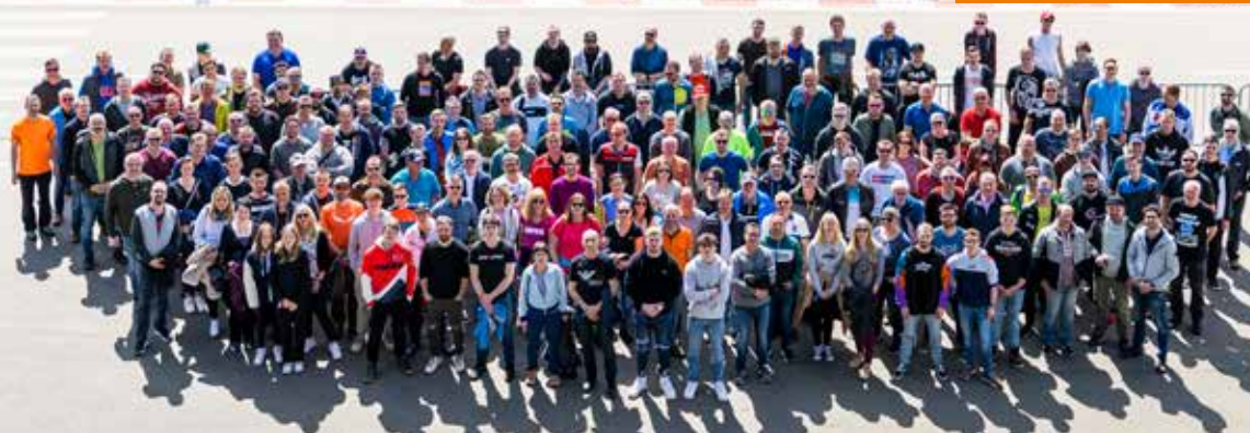
Foto vom Mitarbeitererevent am Red Bull Ring