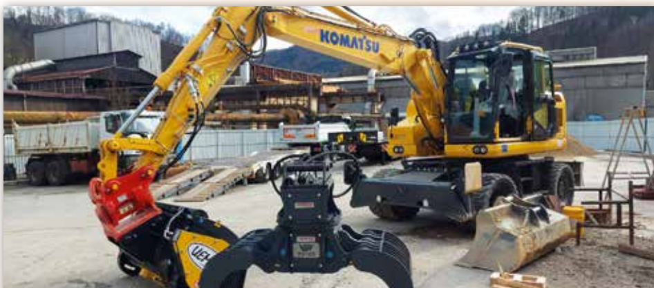
Das Foto zeigt die Lieferung eines Mobilbaggers PW158-11 mit Schaufel und 2 Auslegern, Joystick-Lenkung und Powertilt. Für den perfekten Einsatz der Maschine wurde auch gleich eine Betonmischschaufel Uemme Condor 450 und ein Abbruchgreifer VTN MD140 angeschafft.

zu zwei Radladern WA470-8 und WA475-10, zwei Baggern PC210NLC-11 und einem PC360NLC-11, einem Mini- und einem Midibagger hat Gradnje Žveplan d.o.o. seinen Fuhrpark mit dem jüngsten Kauf eines Komatsu PW158-11 Mobilbaggers erweitert.