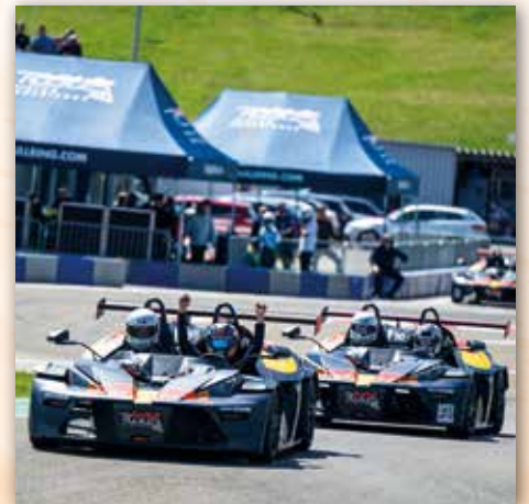
geben GAS ob ONROAD oder OFFROAD“ wird uns allen in Erinnerung bleiben.