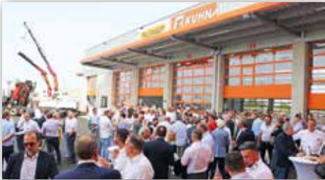
Rund 250 geladene Gäste kamen zur Eröffnungsfest am 22. Juni 2023

Den ersten großen Meilenstein nach Gründung der Kuhn-Baumaschinen GmbH 1973 setzte Kuhn 1986 mit der Übernahme der Generalvertretungen der Palfinger Krane und Mitsubishi Gabelstapler sowie der Gründung der Kuhn-Ladetechnik. Die Firmengruppe setzte von da an auf Spezialisierung und hohe Marktdurchdringung. Schon 1990 erfolgte die erste internationale Expansion mit Gründung der Kuhn KFT in Budapest. Gleichzeitig wird Kuhn mit Mitsubishi Marktführer bei Staplern mit Verbrennungsmotoren. Nach